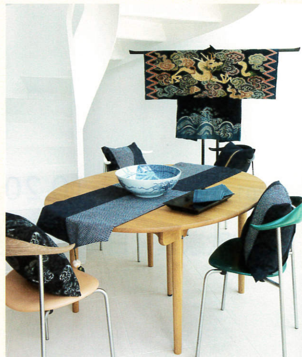
アンティーク着物・帯コレクション&amp;テキスタイル制作 / KEYWORK